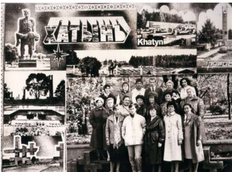
Экскурсия в Хатынь

Ежегодно составлялся план работ на год и на каждый месяц. По перечислению приобретались инструменты – гитары, баян, новогодние игрушки, подарки и призы для проведения мероприятий, «огоньков». Было закуплено новую «одежду сцены» (падуги, кулисы, занавес), ударную установку, кресла в зал.