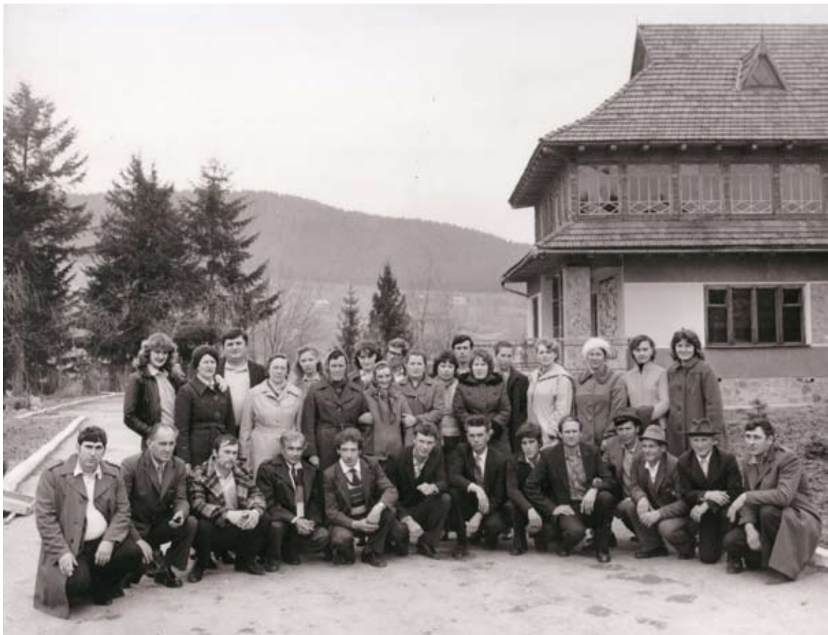
Манявский скит — православный монастырь в селе Манява (Ивано-Франковская область)