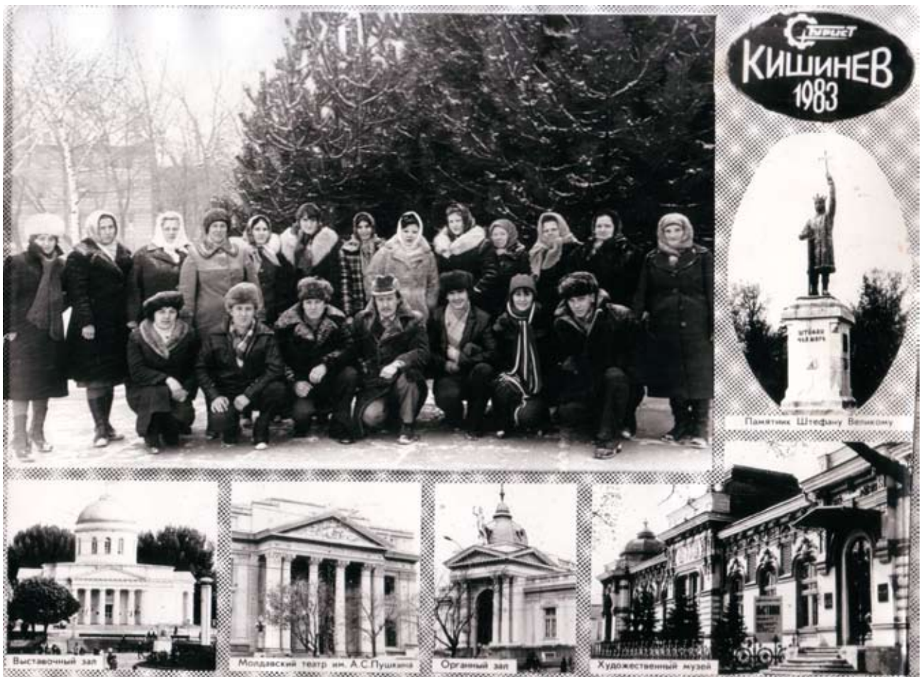
г. Кишинев, 1983 г.