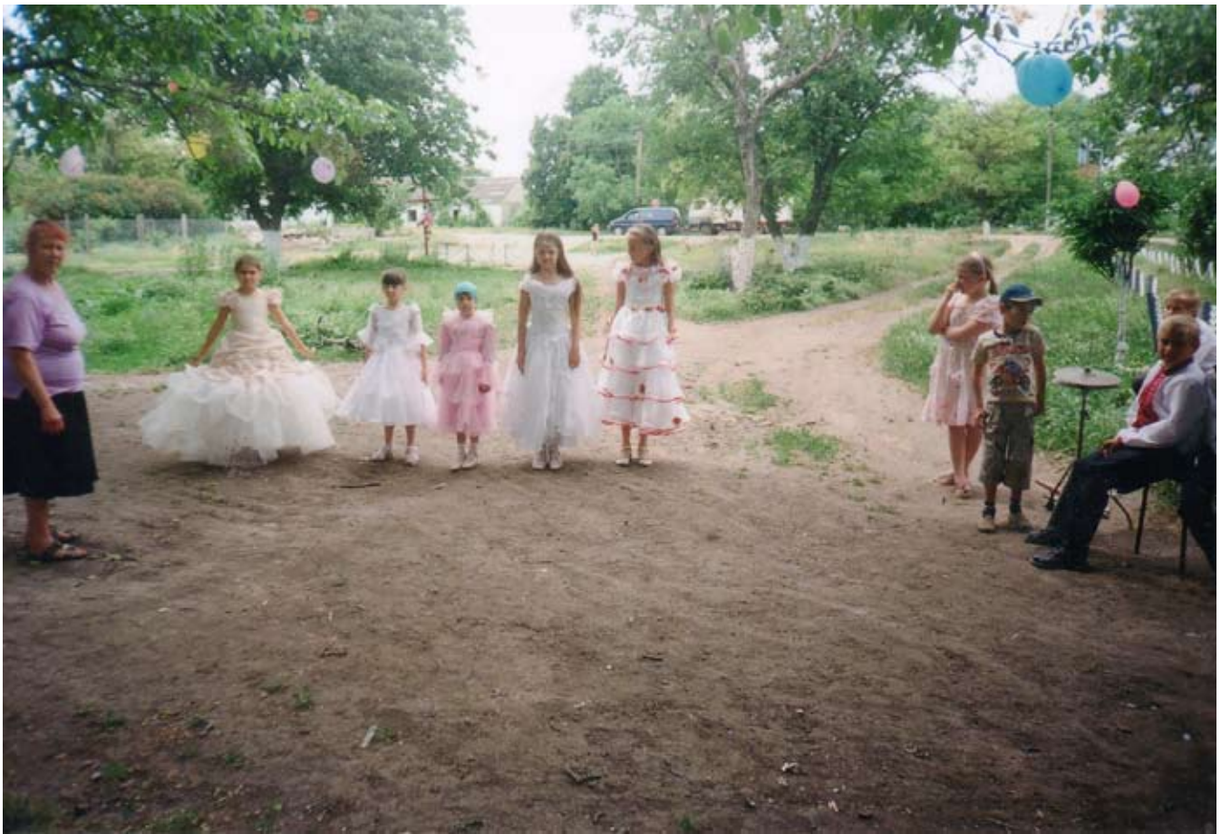
День Независимости 2011 г.

Так, как Клуба фактически не стало - новогодние праздники перешли в более неформальный вид. Рождество, Старый Новый Год, Василия, Меланки – проводились «по старинке» - народные гуляния по селу, со щедривками и колядками. Подростающее поколение охотно поддержали эти праздники.