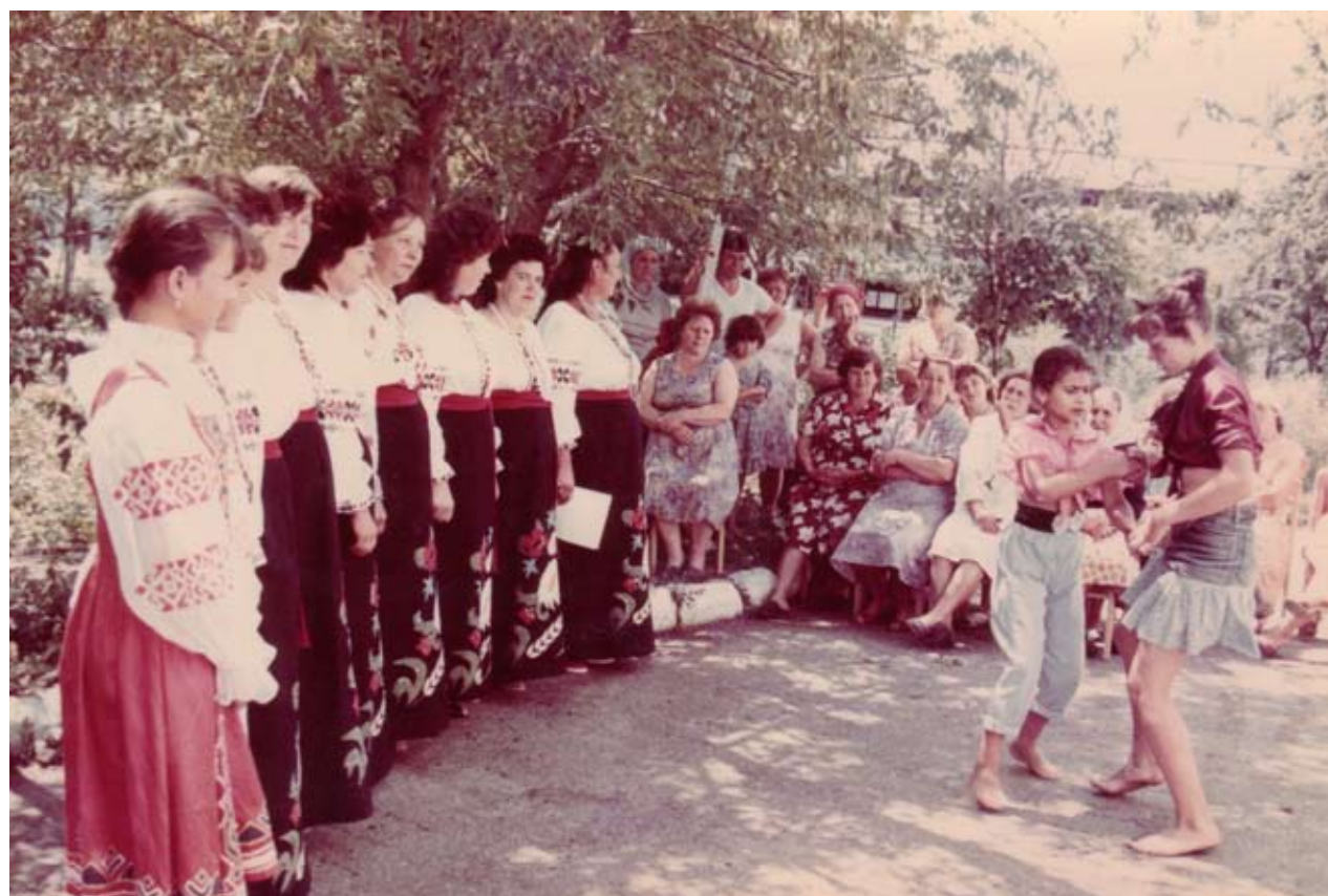
Концерт для труженников животноводства