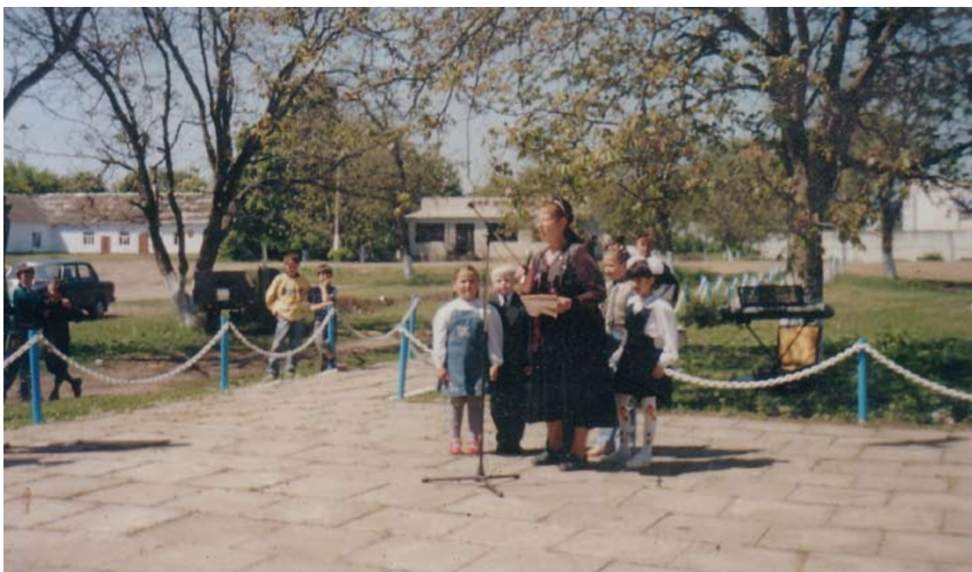
9 мая 2008 года. День Победы