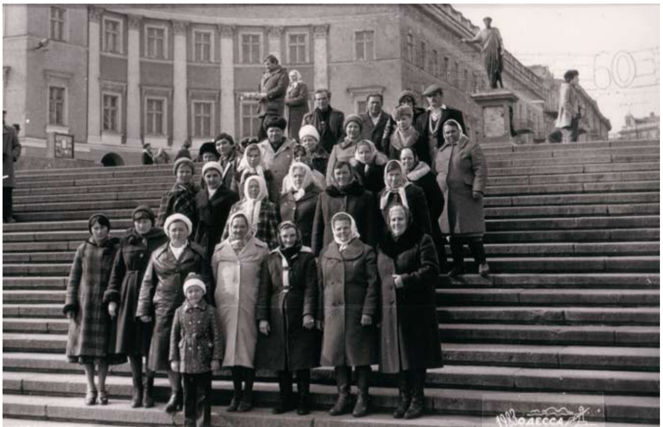
г. Одесса, 1983 г.