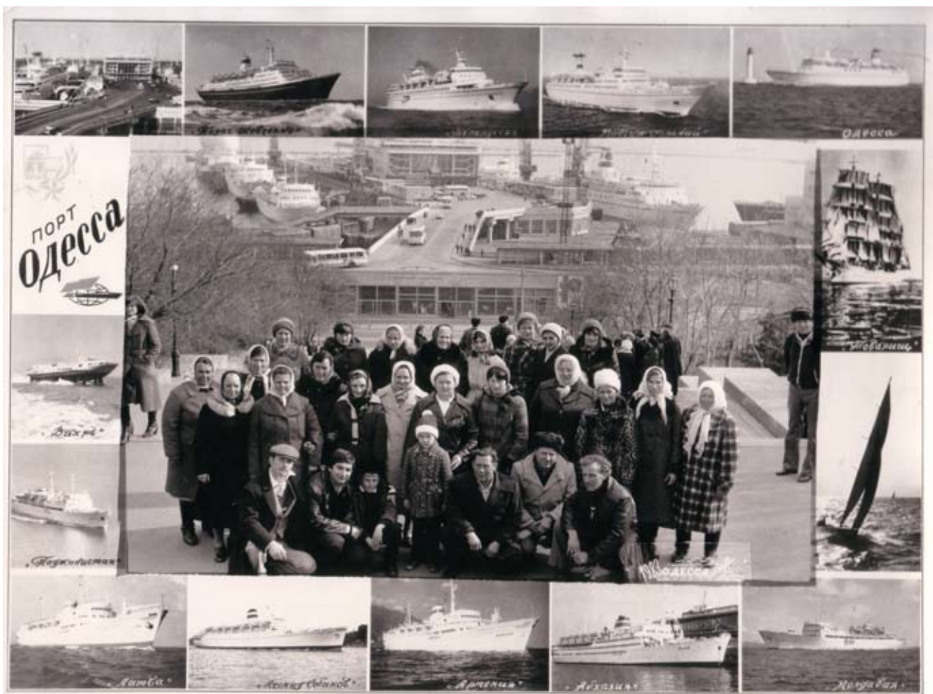
г.Одесса, Потемкинская лестница